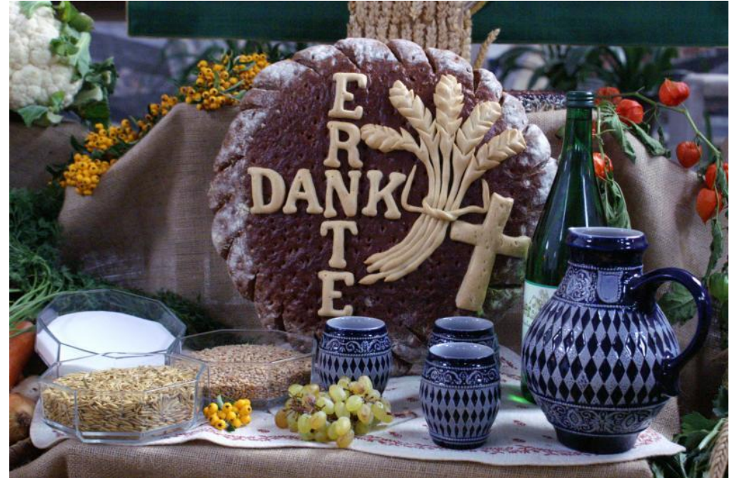
Text nach Gisela Baltes In: Pfarrbriefservice.de

Danken: Für die Früchte der Erde, von denen wir leben.